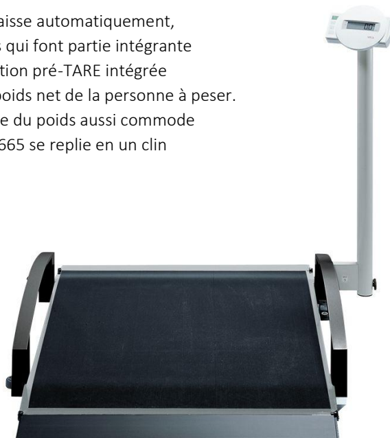
PLATE-FORME DE PESEE AVEC BARRE DE MAINTIEN SECA 677

Elle permet de peser les personnes dans un fauteuil roulant ou sur une chaise. Les personnes handicapées ou infirmes peuvent se tenir à la main courante. Repliable en un tour de main après la pesée, la seca 677 est peu encombrante. Un dispositif d'arrêt entre la main courante et la plateforme de la balance permet de la stabiliser lorsqu'elle est repliée. La main courante sert alors de poignée et les roulettes dont la seca 677 est dotée permettent de la ranger rapidement et sans effort. Les fonctions supplémentaires comme TARE, HOLD, BMI et la touche SEND pour la transmission sans fil des résultats de mesure vers une imprimante sans fil seca ou vers un PC contribuent à son efficacité.