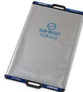
PLANCHE DE TRANSFERT HIGHTEC ROLLBORD – ICU BARIATRIC

Convient aux soins intensifs et Bariatric, aux matelas pneumatiques et aux matelas anti-escarres.